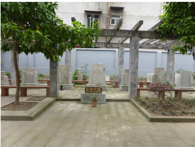
(圖2) 閬中教堂外之宣教士墓園