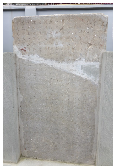
(圖5) 貝教士重新再立之墓碑

教士諱永光大英女...慈良資稟聰穎熱心主道飽飲經筵本基督博愛之精神抱救己...志願於清光緒季年來華傳福音於千福場教士之作主工也...年靈命竟忘自己苦辛不避風雨不重與乘兢焉諄諄焉至誠所...道孔多於是建聖殿開支堂辦學校皆井井有條他如濟貧困施醫藥...慈善靡不抱福利人群之旨其最足稱者則於傳之外因見連年荒...遺孤孩盈塞道路教士於牧養之餘於千建孩院一所嗣因房舍難容...於儀之大尼閣之白廟各置房產一份移孤孩居並聘華執事助理教...復時往看視舉凡理髮垢問飢寒施醫服藥膿潰調護之殷雖慈母保亦不是過也其尤可欽者教士於撫養之餘復以技能俾造成有用才期能服務教會其愛人也若此而自奉則非常約布衣素食與孤營寢處共生活其克己利人為何知乎教士墓碑原建於一九三一年越二毀於兵變今末等男有室而女有家追懷往昔撫育之恩誠恐生平事蹟沒而弗彰爰集資重鑄表諸墓期垂久遠非徒供憑弔已也是為記先後恩男女重豎時一九四七年三月。◇