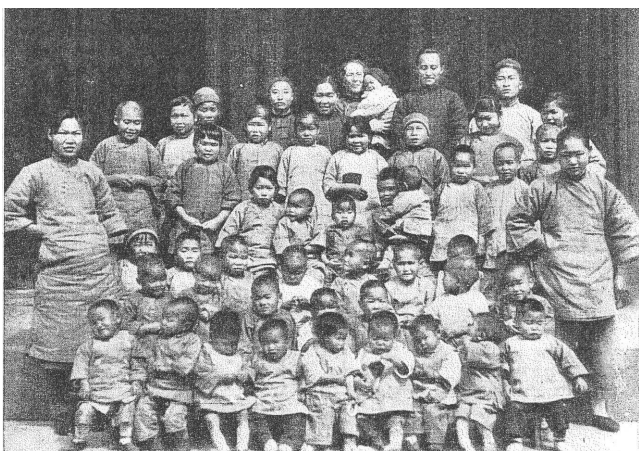
(圖3) 孤兒院：貝姑娘手抱著嬰兒站在最後一排