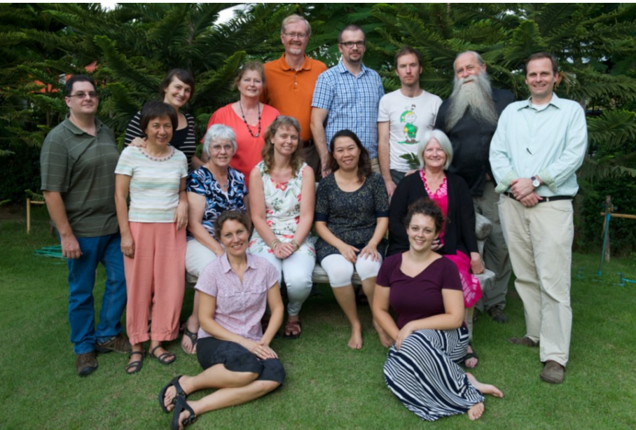
The Well 宣教士關顧團隊（2014 年）

在宣教工場中，支持系統的缺乏是宣教士所面對的最大挑戰之一。遠離家人、朋友、教會弟兄姊妹這些重要的支持系統，再加上與當地人之間的語言和文化隔閡、以及悟性和屬靈程度的差異，外加保密和見證的考量，面對壓力、困難、挑戰時，宣教士常常找不到合適的對象述說心中的困惑和苦楚。「The Well 宣教士關顧中心」存在的目的，就是提供宣教士一個安全的環境，扮演他們的「回音板」，幫助他們釐清思緒和情緒，知道如何來面對各樣的挑戰。